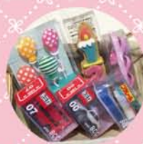
★ キャンドル各種 100yen~