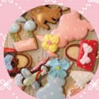
★ アイシングクッキー 300yen~