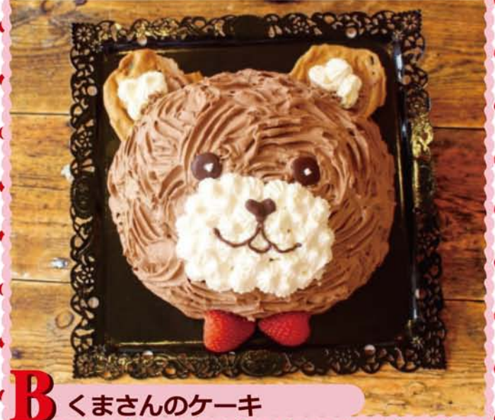
B くまさんのケーキ

チョコ生クリームでデコレーションした、くまさんの顔のケーキはいかが？ベースはココアスポンジの生チョコケーキです。