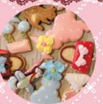
* アイシングクッキー 300yen~