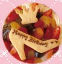
プリンセスセット 350yen