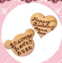
くま・ハート (L) 各 300yen