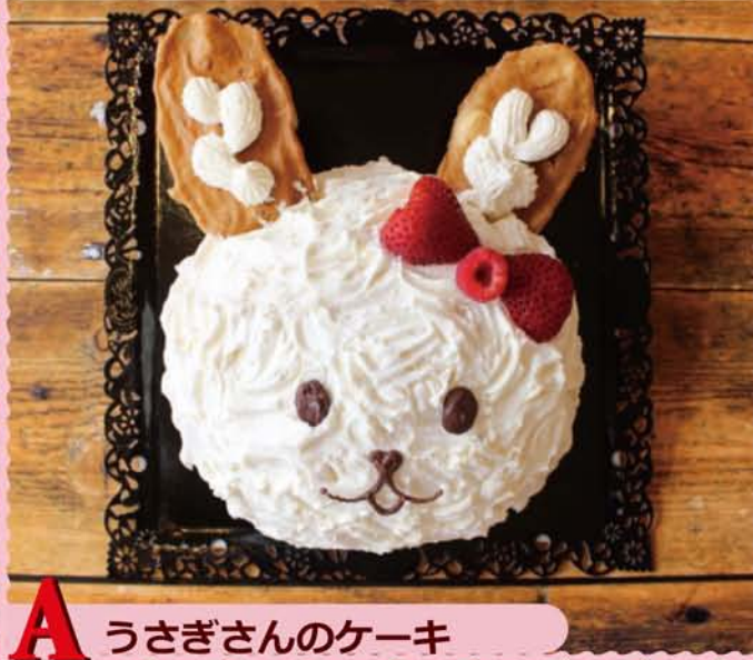
A うさぎさんのケーキ

ドームタイプの生クリームケーキを、かわいいうさぎさんの顔にしあげました。ふんわりスポンジにたっぷりイチゴをサンドして。