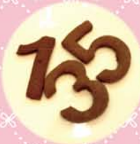
ナンバークッキー (S) 各 50yen