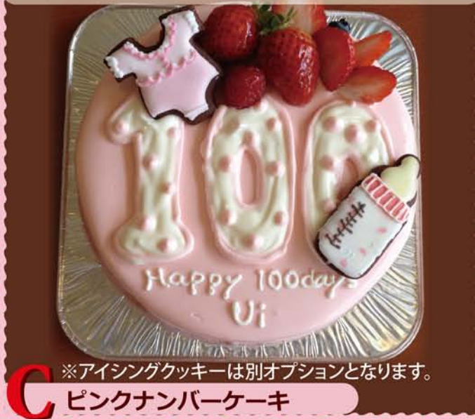
C ※アイシングクッキーは別オプションとなります。 ピンクナンバーケーキ

年齢や、記念日の数字を入れて作りする、ピンクのグラサージュがかわいい人気のケーキ。ベースはイチゴショートケーキです。