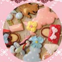
* アイシングクッキー 300yen~