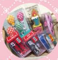
★ キャンドル各種 100yen～