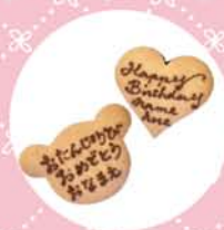
くま・ハート (L) 各 300yen