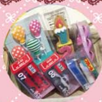
* キャンドル各種 100yen~