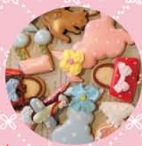
★ アイシングクッキー 300yen～