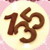
ナンバークッキー (S) 各 50yen