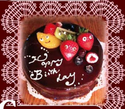
G グラサージュ・ショコラ