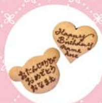
くま・ハート(L) 各 300yen