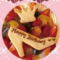
プリンセスセット 350yen