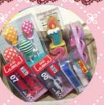
* キャンドル各種 100yen~