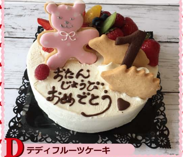
D テディフルーツケーキ

パティシェ手作りのティディベアのアイシングクッキーをのせました。ケーキにはイチゴをサンド。生チョコタイプもございます。