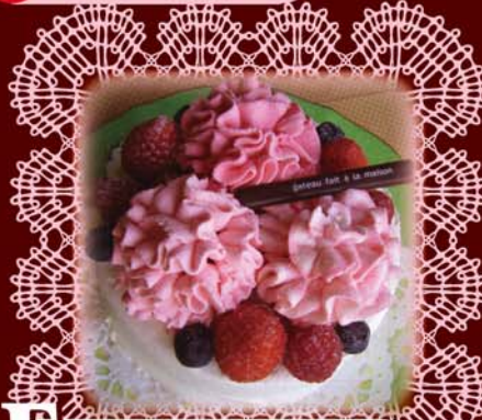
E フラワリーケーキ